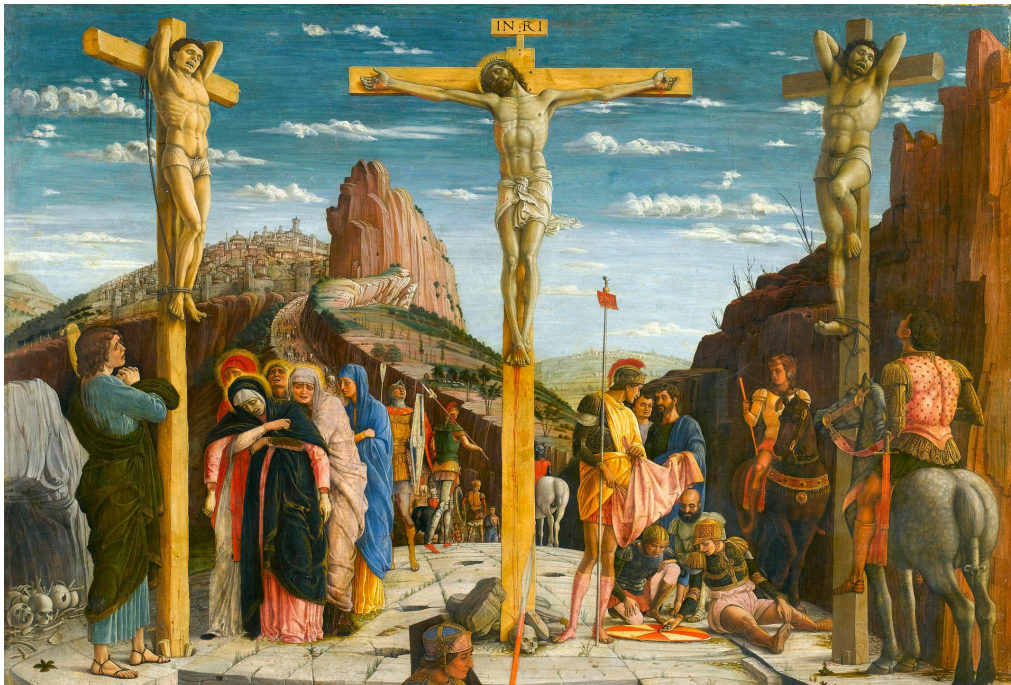
Mantegna, Crocifissione , 1459

Herr, unser Herrscher dessen Ruhm in allen Landen herrlich ist! Zeig' uns durch deine Passion, dass du, der wahre Gottessohn, zu aller Zeit, auch in der grössten Niedrigkeit, verherrlicht worden bist.