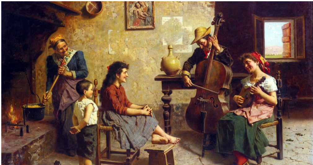
E.Zampighi, Musica rustica , 1926

“Some to the lute, some to the viol went, And others chose the cornet eloquent, These practising the wind, and those the wire, To sing men’s triumphs, or in heaven’s choir.