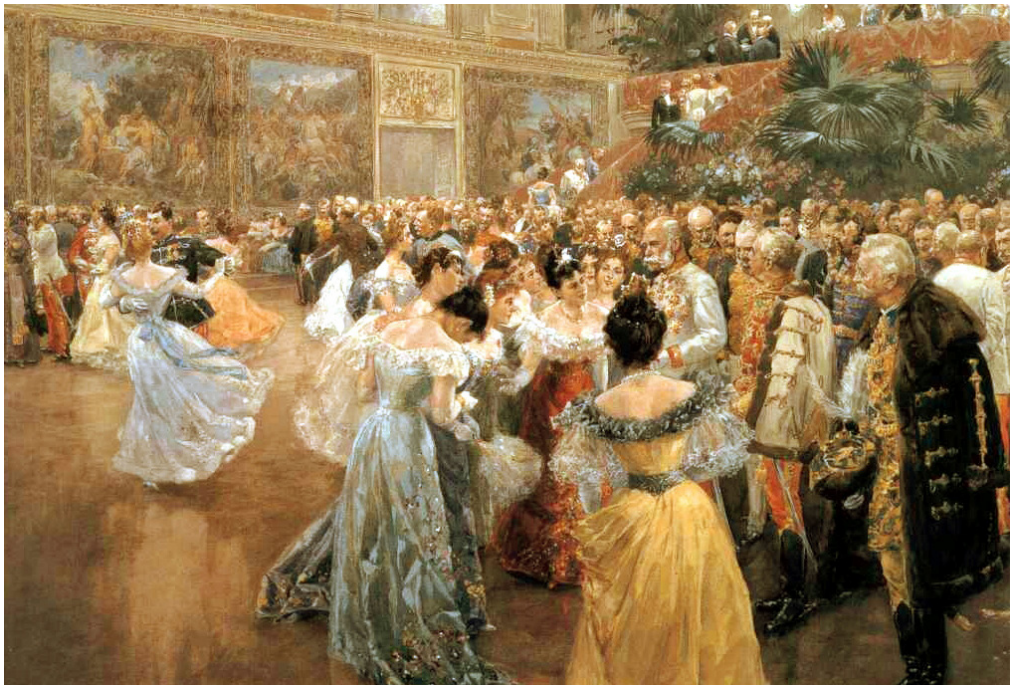
W.Gause, Hofball in Wien , 1900

"Ci sarà sempre un'altra opportunità, un'altra amicizia, un altro amore, una nuova forza. Per ogni fine c'è un nuovo inizio."