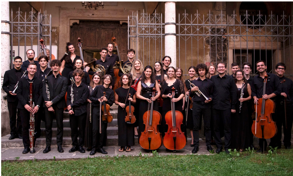
Orchestra Crescere in musica, 2023

“La musica è come la vita, si può fare in un solo modo: insieme.”