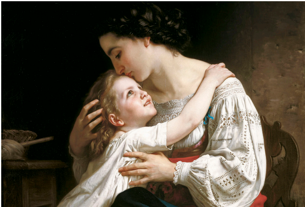
W-A. Bouguereau, Le Lever , 1865

“Non si deve insegnare la musica ai bambini per farli diventare grandi musicisti, ma perché imparino ad ascoltare e, di conseguenza, ad essere ascoltati.”