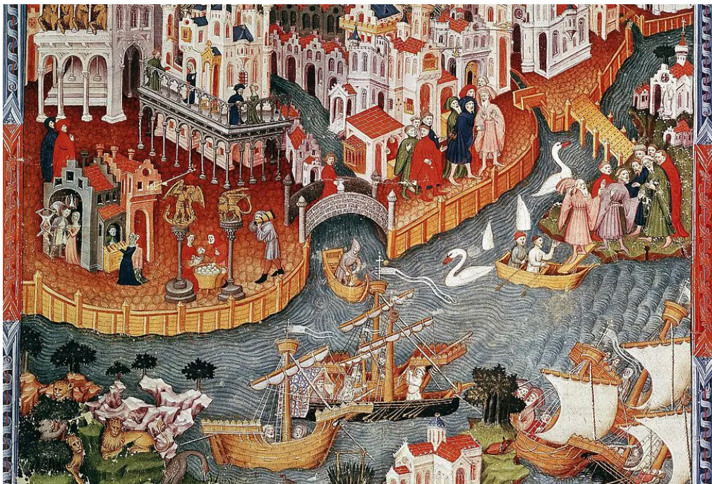
Anonimo, Marco Polo vela da Venezia nel 1271 , XV secolo

“Il Milione, nato quasi per caso nelle carceri genovesi, nel 1298, non è solo il più famoso libro di viaggi della storia occidentale. Quello che lo rende unico è lo sguardo di Marco: acuminato, preciso come un registro mercantile, capace di tener conto anche dei dettagli più minuti. Ma al contempo uno sguardo morbido, che sa essere pietoso, simpatico, aperto. Scoprire, capire, raccontare, questa è la missione di Marco Polo.”