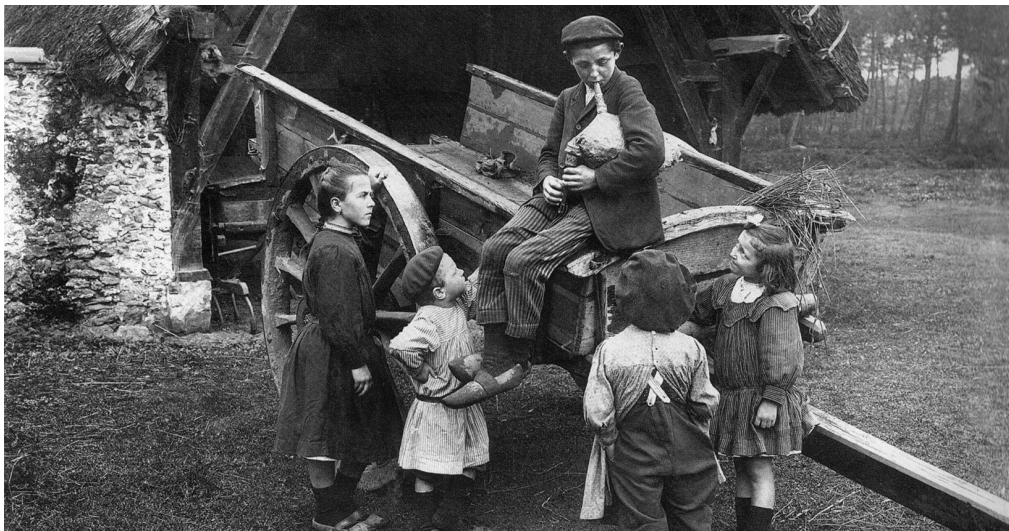
Il giovane zampognaro, primi del '900

Il primo progetto cameristico nasce dalla volontà di andare a scavare attraverso gli occhi e la consapevolezza di oggi le tradizioni musicali di popoli vicini e lontani, scoprendone le radici, le speranze e i valori. L'associazione "Crescere in musica", partendo dal capolavoro Folk songs di Luciano Berio, decide di commissionare al giovane compositore padovano Dario Michelon la reinterpretazione in chiave contemporanea di sei "Cansoni" popolari venete, raccolte negli anni dalla Bandabrian. Per offrire l'opportunità a giovani cantanti soprano e mezzosoprano di approfondire la conoscenza del repertorio musicale contemporaneo, viene indetto un Concorso vocale presieduto da Gemma Bertagnolli (Conservatorio di Milano). Il risultato di quest'opera unica nel suo genere verrà presentato anche in forma di lezioni concerto rivolte agli studenti del Liceo "F. Corradini" di Thiene.