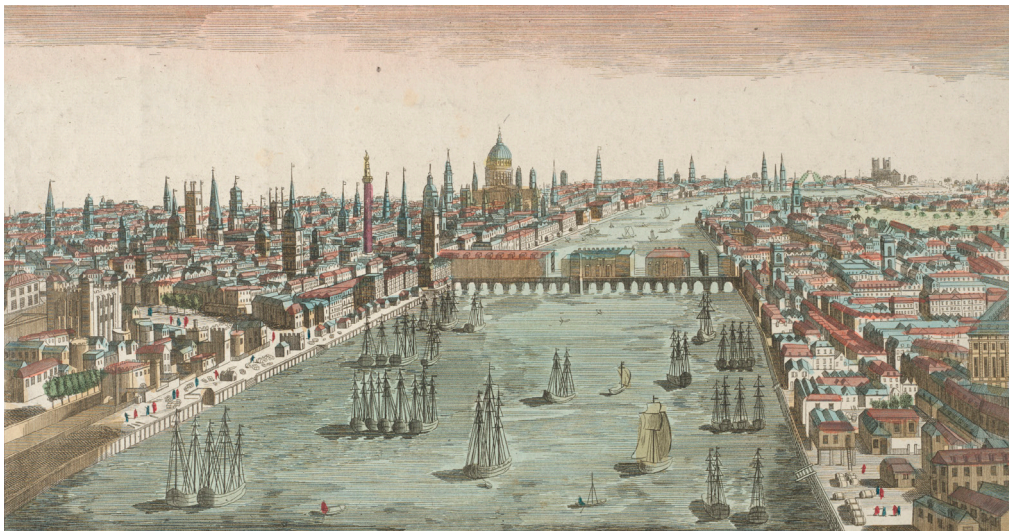
General view of London, XVIII secolo