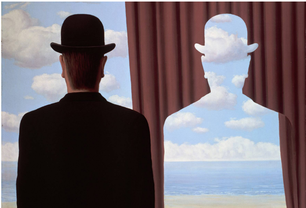
R. Magritte, Decalcomania , 1966

“Senza l’esperienza dei valori le nostre vite sarebbero prive di senso e le persone prive di identità.”