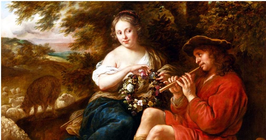
G.Flinck, Elegant Shepherdess Listening to a Shepherd Playing the Recorder in an Arcadian Landscape , 1654