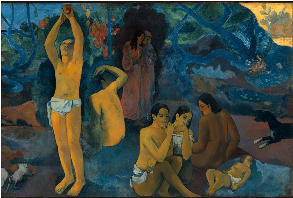
P.Gauguin, D'où venons-nous? Que sommes-nous? Où allons-nous? , 1898

"...Venite, amici miei, non è troppo tardi per cercare un mondo più nuovo. Spingetevi al largo, e sedendo bene in ordine percuotete i sonori solchi; perché il mio scopo consiste nel navigare oltre il tramonto, e i bagni di tutte le stelle occidentali, finché io muoia. Potrebbe succedere che gli abissi ci inghiottiranno: potremmo forse toccare le isole felici, e vedere il grande Achille, che noi conosceremo. Anche se molto è stato preso, molto aspetta; e anche se noi non siamo ora quella forza che in giorni antichi mosse terra e cieli, ciò che siamo, siamo; un'eguale indole di eroici cuori, fiaccati dal tempo e dal fato, ma forti nella volontà di combattere, cercare, trovare, e di non cedere."