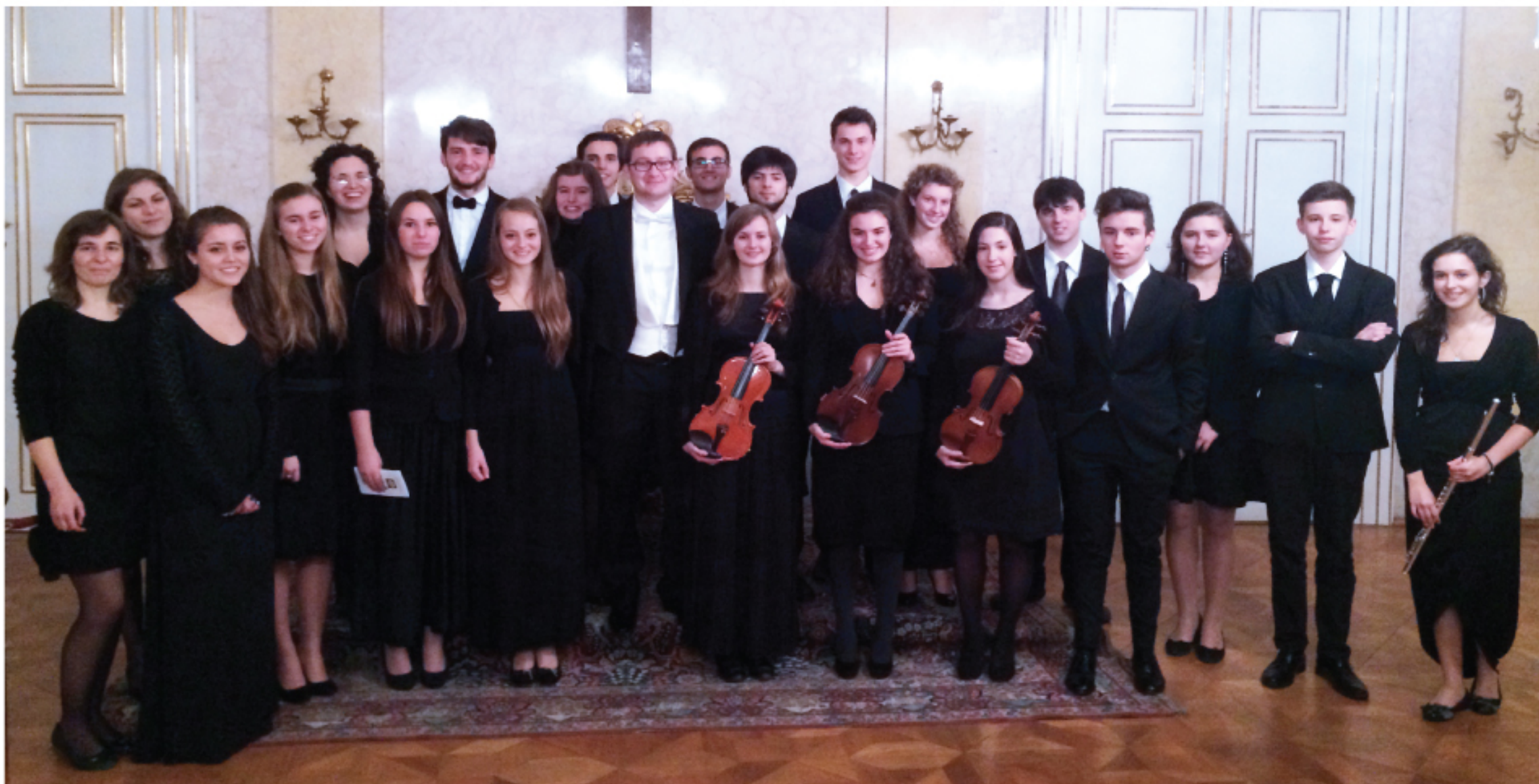
Orchestra "Crescere in musica", Palazzo Arcivescovile di Olomouc (2014)